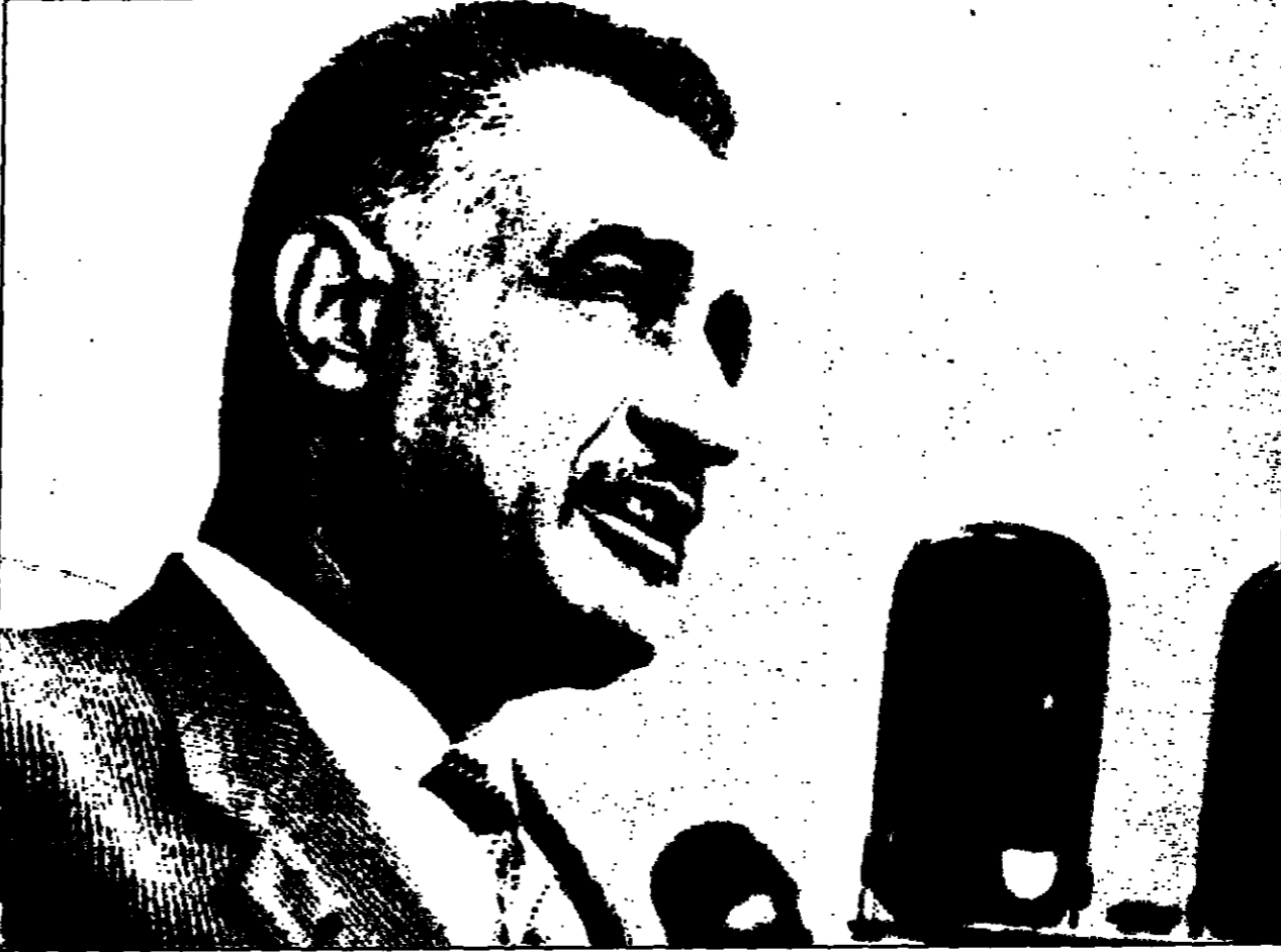
جمال عبد الناصر (القس العربي)